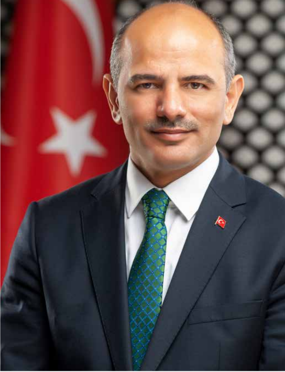
Şener SÖĞÜT Körfez Belediye Başkanı