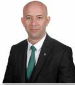
VOLKAN ÖZMEN MHP