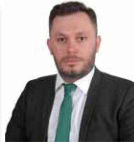
RECEP AKOVA AK PARTİ